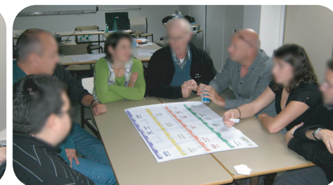
Groupes de travail autour des plateaux de jeux sur le Développement Durable