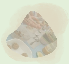
Alimentation et agriculture