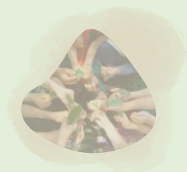
Nature et Santé