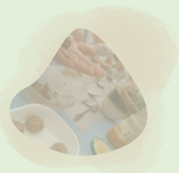
Alimentation et agriculture