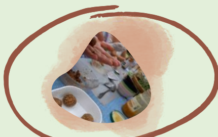
Alimentation et agriculture