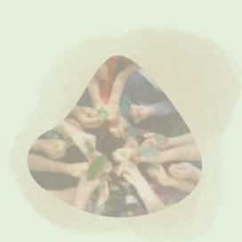
Nature et Santé