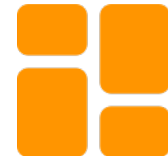
Tableau pour coordinateur