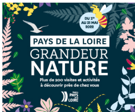
Pays de la Loire Grandeur Nature

La manifestation Pays de la Loire Grandeur Nature met en valeur la biodiversité ligérienne, sa beauté et sa fragilité, et donne un coup de projecteur sur le travail des structures qui font de la biodiversité et de l'éducation à l'environnement leur quotidien. Chaque année sur le mois de mai, depuis 2018, la manifestation valorise l'ensemble des animations biodiversité proposées par les acteur-trices régionaux à destination du grand public.